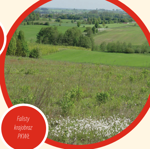
Falisty krajobraz PKWŁ

W krajobrazie środkowej Polski strefa krawędziowa Wzniesień Łódzkich zdecydowanie wyróżnia się zarówno formami ukształtowania jak i walorami przyrodniczymi. Malownicze krajobrazy, stosunkowo niewielki stopień zurbanizowania, a także ciekawa kultura i historia tego miejsca stanowiły argumenty przemawiające za objęciem ochroną tego obszaru.