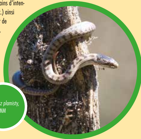
Gniewosz plamisty, MM